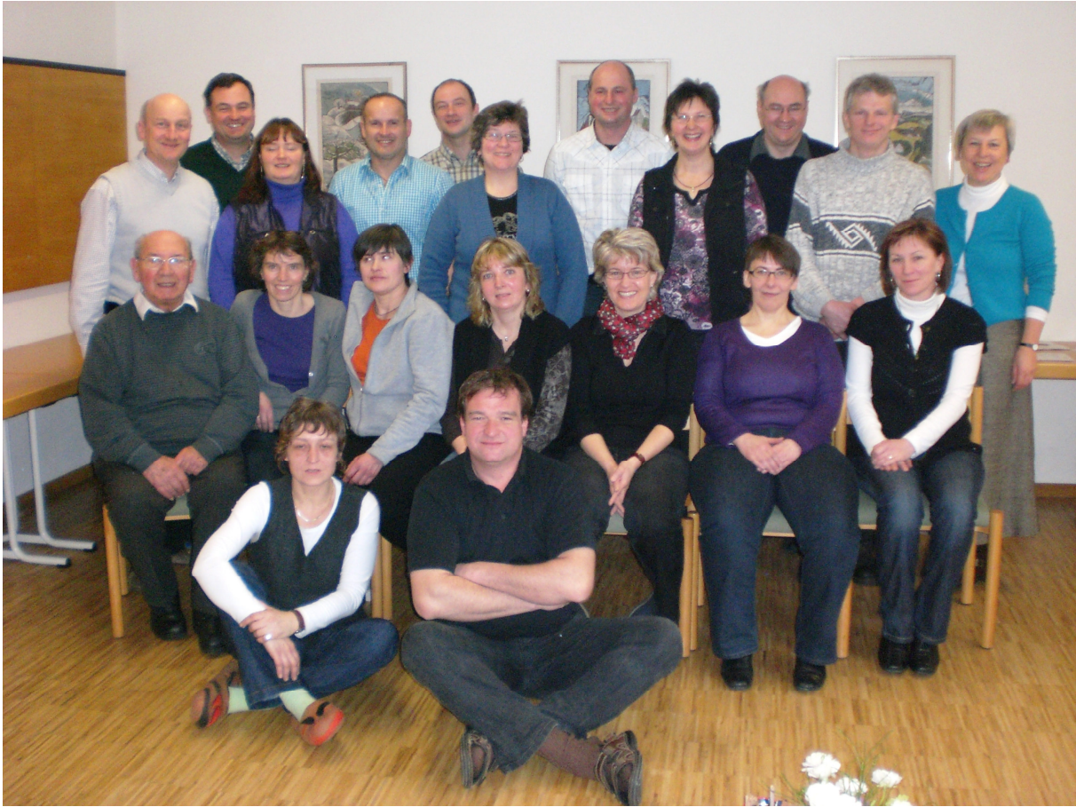
2010 – 20-jähriges Jubiläumstreffen

Der Weg für eine neue Entwicklung war frei.