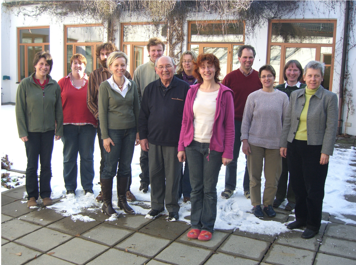
2009 – 15-jähriges Jubiläumstreffen

Aufgrund dieser Entwicklung , der Unzufriedenheit vieler Regionalsprecher und der Situation in den meisten Regionen wollte man eine Lösung zur Neuausrichtung des Beirates , zur Stärkung seiner Arbeit und dem sinnvollen Weiterbestand des Beirates, aber auch der ganzen Gemeinschaft finden.