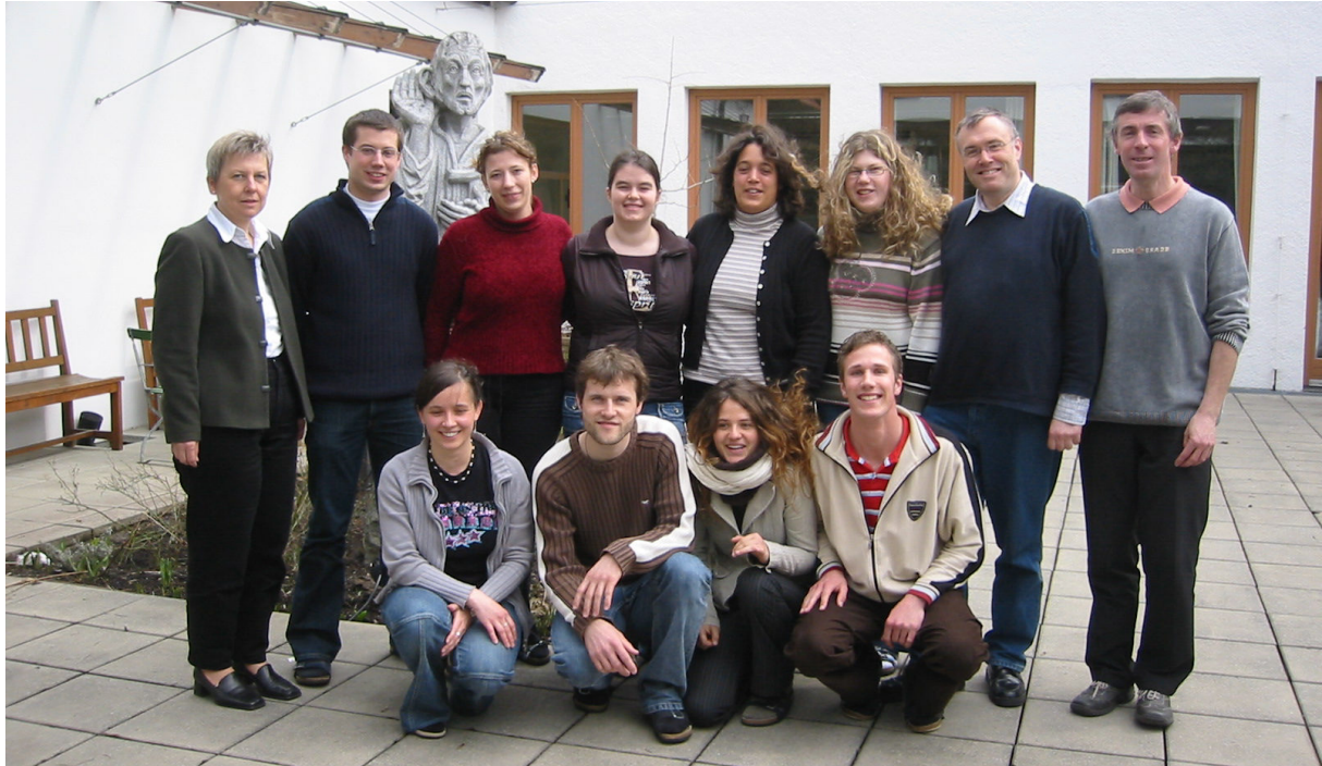
2006 – Kursfoto

Im Juni 1999 wurde beim Haupttreffen über eine Namensänderung der Gemeinschaft abgestimmt. Aus Ehemaligengemeinschaft wurde die Gemeinschaft der Ehemaligen und Freunde der LVHS. Man wollte durch diesen neuen Namen signalisieren, dass die Gemeinschaft offen ist für alle, die sich der LVHS verbunden fühlen.