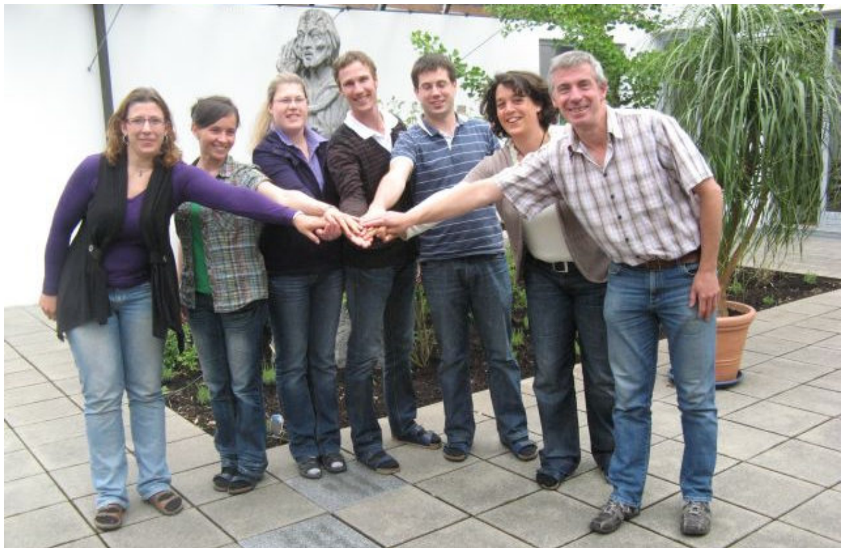
2006 – 5-jähriges Jubiläumstreffen