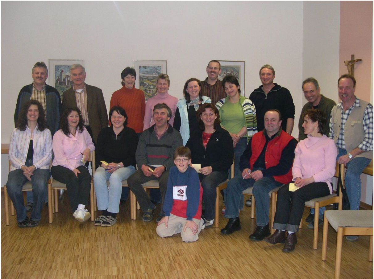
2006 – 25-jähriges Jubiläumstreffen