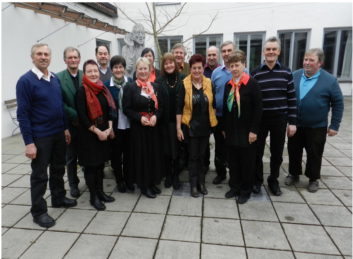
2013 – 40-jähriges Jubiläumstreffen

Im Laufe der Zeit machte sich jedoch in den meisten Regionen der Trend bemerkbar, dass der Zuspruch immer weniger wird. Und der Frust bei den Sprechern immer mehr. Dies war auch sehr spürbar und oft dominierend in den Beiratssitzungen in NA.