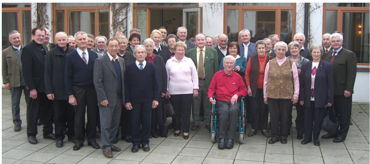
2009 – 50-jähriges Jubiläumstreffen

In diesen Regionen gab es jeweils möglichst zwei Sprecher/innen, wenn möglich paritätisch besetzt. Es fanden alle drei Jahre Wahlen statt.