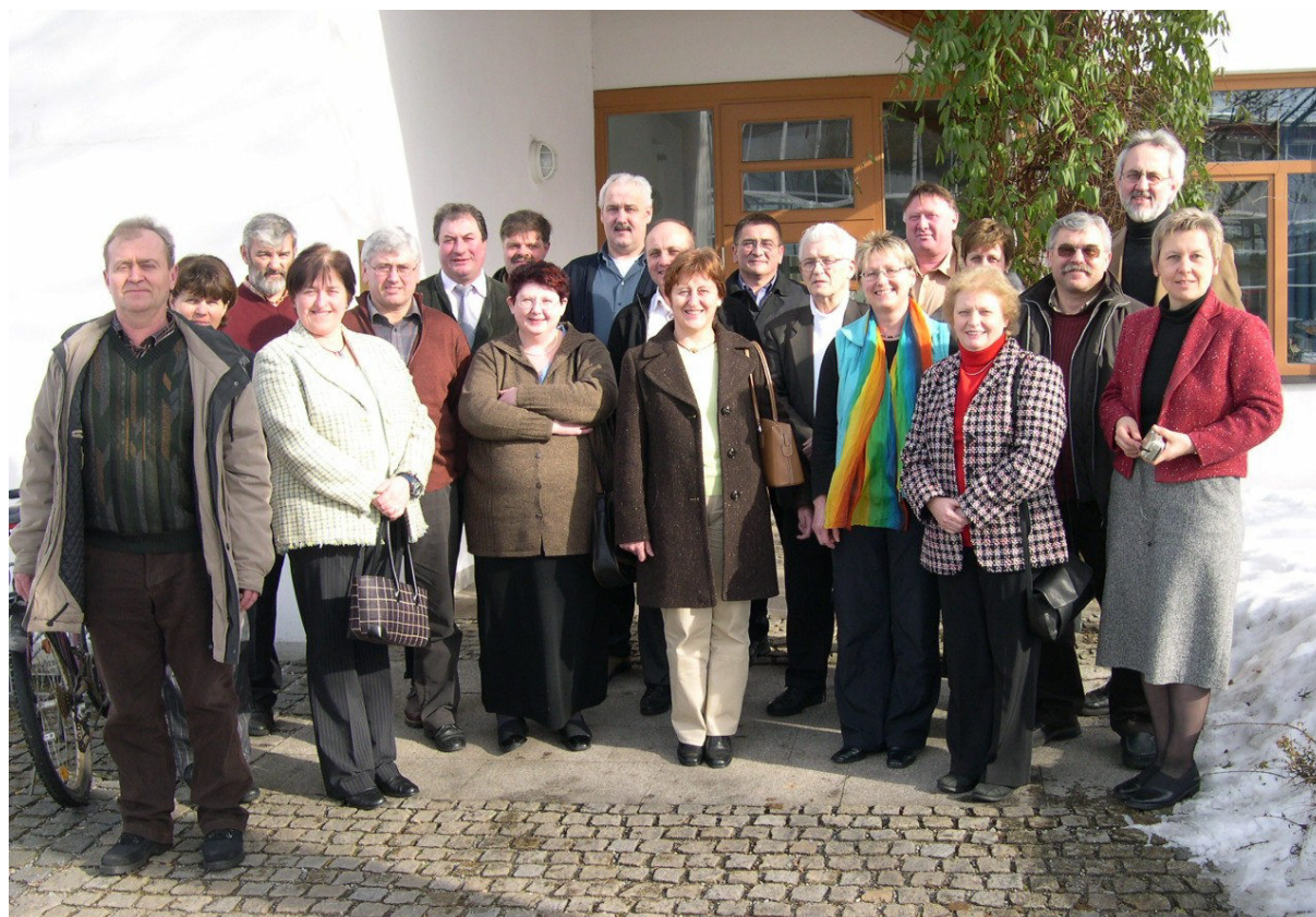
2006 – 30-jähriges Jubiläumstreffen