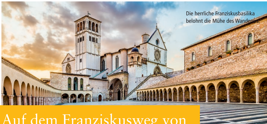
Die herrliche Franziskusbasilika belohnt die Mühe des Wanders.