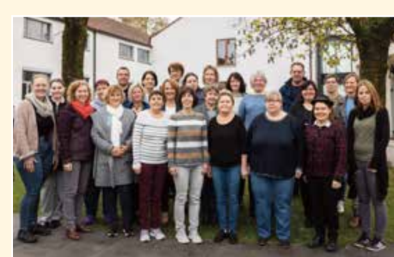
Mitarbeiter*innen der LVHS

Die Anmeldung erfolgt schriftlich, telefonisch oder per Internet. Die Kursgebühr wird nach Beginn der Veranstaltung von Ihrem Konto abgebucht, darum bei der Anmeldung bitte stets die Bankverbindung angeben. Sie erhalten ca. 2 Wochen vor Kursbeginn eine schriftliche Anmeldebestätigung. Eine Absage ist bis 4 Wochen vorher kostenfrei möglich. Danach berechnen wir laut unseren Geschäftsbedingungen 12 Euro, ab 2 Wochen 25%. Bei Absage am Vortag/Tag des Seminars 100%. Preis: Die im Programm aufgeführten Preise beinhalten Kursgebühr, Übernachtung und Vollpension. Die Unterbringung erfolgt im Doppelzimmer mit Dusche/WC (Einzelmierzuschlag: 5,50 Euro pro Person/Nacht). Vegane Kost, Unverträglichkeiten usw. nach Absprache (Aufpreis: 20%). Nähere Einzelheiten entnehmen Sie bitte unserer Homepage.